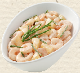
Käptn's Cocktail Garnelen kombiniert mit fruchtigen Ananasstückchen, Kürbis und Sellerie, in cremigem Dressing, 100 g