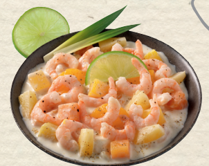
Fruchtiger Shrimps-Cocktail Miami Shrimps mit Ananas, Pfirsichen, Papayas und Champignons, in fein gewürzter Mayonnaise, 100 g