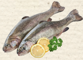
Regenbogenforellen ausgenommen, küchenfertig, aus Aquakultur, 100 g