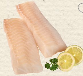
MSC Kabeljaurückenfilets ohne Haut, 100 g