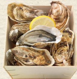
Austern „Fines de Claire“ 6 delikate Fines-de-Claire-Austern, mit passendem Austernmesser, Box