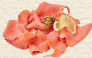
Räucherlachs geschnitten typisches Raucharoma, 100 g