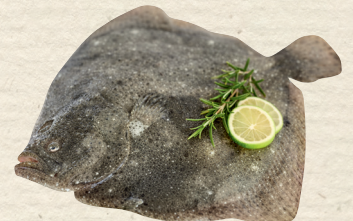
Frischer Steinbutt ganz, aus Aquakultur, ca. 1,2-1,5 kg, 100 g