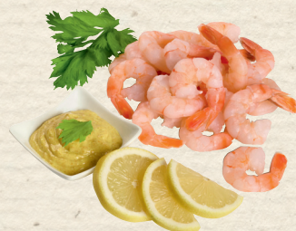
Party-Garnelen gekocht, ohne Schale, feines knackiges Fleisch, zum Verkauf aufgetaut, 100 g