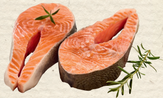
Lachsforellensteaks aus Aquakultur Schottland, besonders geeignet für Grill und Pfanne, 100 g