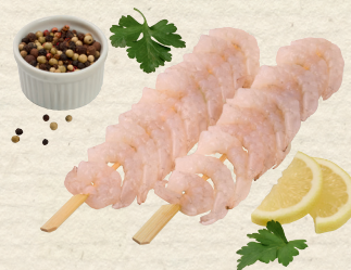
Garnelenspieße zum Verkauf aufgetaut, der ideale Begleiter zum Salat, zum Grillen geeignet, 100 g