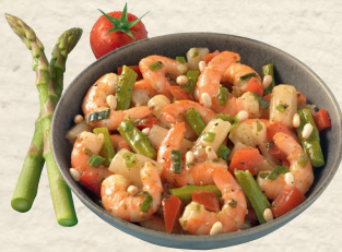
Garnelen-Spargel-Salat knackig-zarte Garnelen und feiner Spargel, raffiniert abgeschmeckt mit Bärlauchpesto, Lauchzwiebeln und Pinienkernen, 100 g