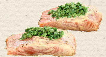
Lachsfilets mit Spargel Lachsfilet mariniert mit Sauce hollandaise, garniert mit Spargel, 100 g