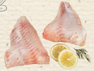
Isländische Rotbarschfilets festes Fleisch, ein leichter und frischer Genuss, gefangen im Nordostatlantik, 100 g