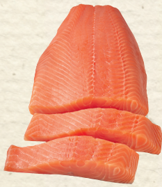
Lachsfilets mit Haut, aus Aquakultur, 100 g