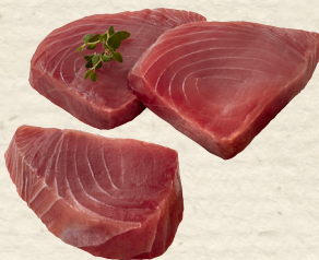
Thunfisch-Steaks das beste Stück vom Thunfisch, ideal zum Grillen und Braten, 100 g