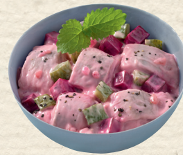
Heringssalat rot Heringsfilethappen mit Rote Bete und Zwiebeln, in pikant gewürzter Salatmayonnaise, 100 g